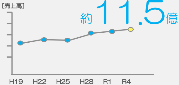
[ 業績推移 ]

全体の約4分の1（石川本社は約3分の1）が30歳以下で、若い社員が多く在籍・活躍している会社です。製造現場には女性も多く働いております。